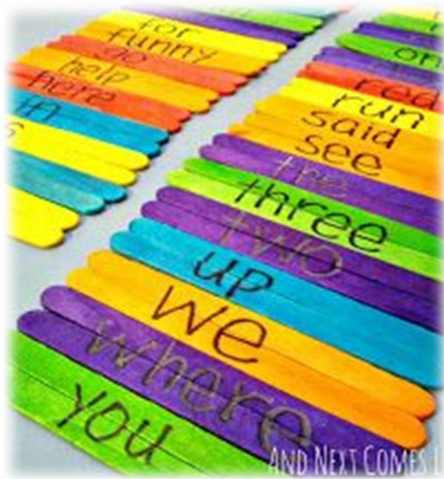
AND NEXT COMES...